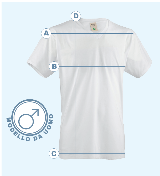
Tabella taglie uomo