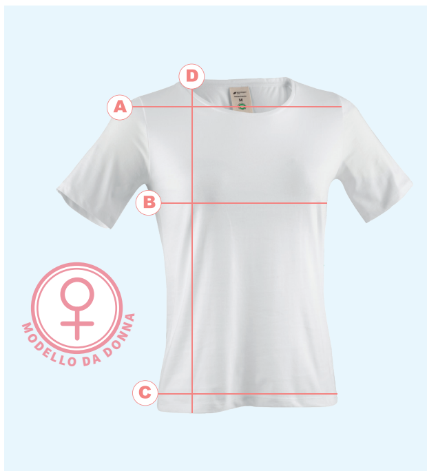
Tabella taglie donna