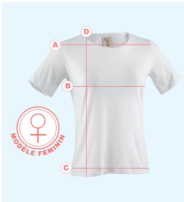
Tableau des tailles pour femmes