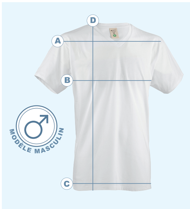
Tableau des tailles pour hommes