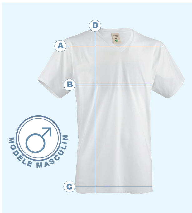
Tableau des tailles pour hommes