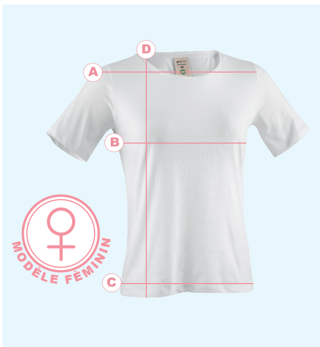
Tableau des tailles pour femmes