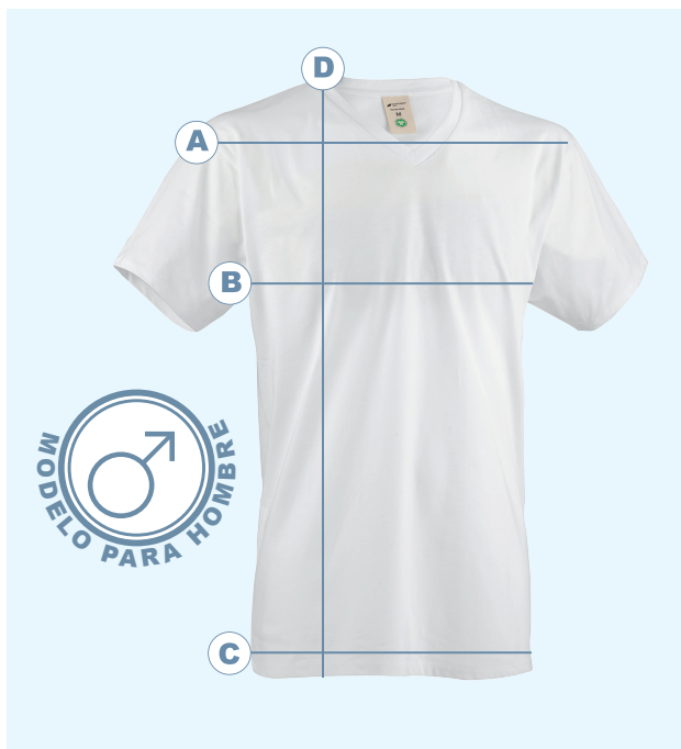
Tabla orientadora de tallas de hombre